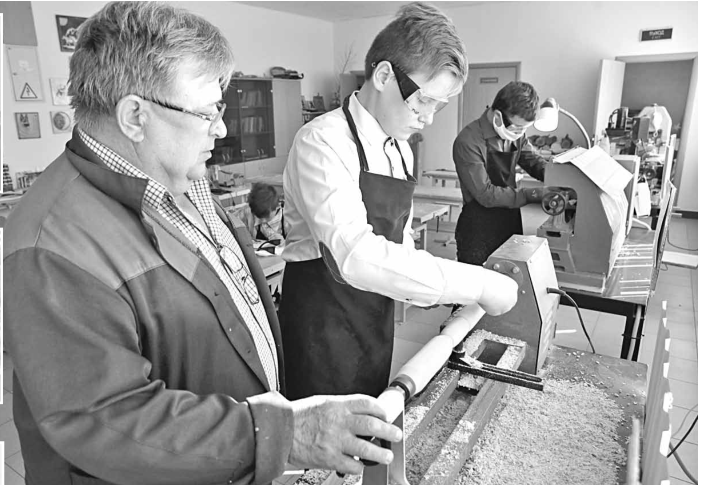
На уроке технологии в школьной мастерской