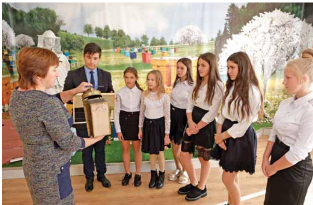
В музее мёда Владимировской школы