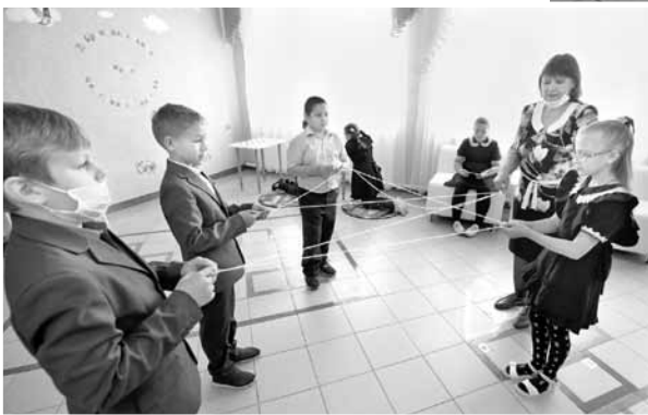
Четвероклассники играют в «Паутинку добра»