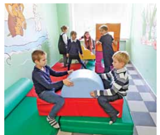
Игровая зона для младшеклассников в Курасовской школе

Сельские школы Белгородской области доказали: даже в маленькой школе можно так организовать учебно-воспитательный процесс, что ученики городских школ будут завидовать сверстникам из маленьких населённых пунктов. Смотрите сами: в сельских школах больше пространства, которое можно использовать для развития детей. У них и территория побольше, чем у городских, — значит, можно не просто газоны, а целые парки и дендрарии обустроить. Не говоря уже об опытных участках. Оснащаются многие сельские школы на самом высоком уровне, потому что участвуют во многих федеральных и региональных проектах. И учителя в небольших школах работают опытные и доброжелательные. Так что уже можно начинать завидовать школьникам из сёл и посёлков.