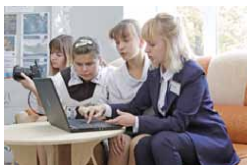
В Курасовской школе работает кружок «Юный блогер», ребята публикуют новости школы в Инстаграме