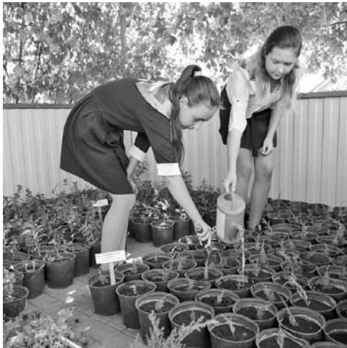
В школе выращивают растения с закрытой корневой системой