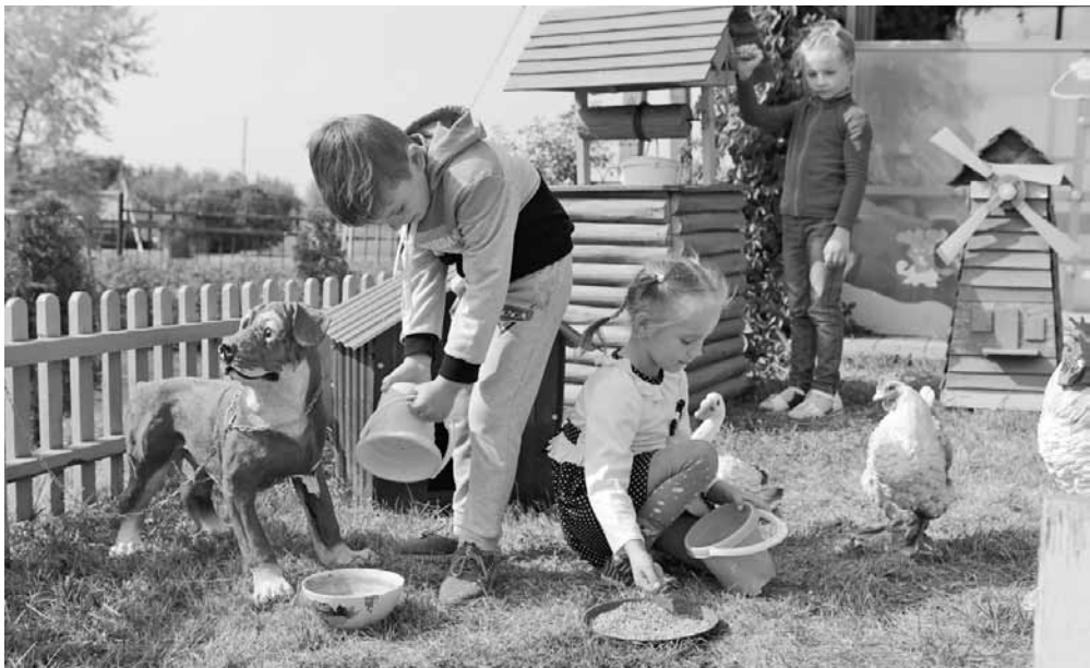
На «Фермерском дворике»

Ольга МУШТАЕВА » ТЕКСТ