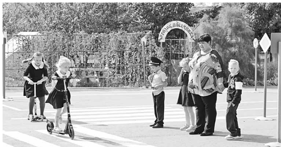
В «Автогородке» школьники на практике учат Правила дорожного движения

ЗА 45 ЛЕТ КЛИМЕНКОВСКАЯ ШКОЛА ВЫПУСТИЛА 575 УЧЕНИКОВ, 24 ИЗ НИХ НАГРАЖДЕНЫ ЗОЛОТЫМИ И СЕРЕБРЯНЫМИ МЕДАЛЯМИ, 30 СТАЛИ ПЕДАГОГАМИ (12 ИЗ НИХ ВЕРНУЛИСЬ ПРЕПОДАВАТЬ В РОДНУЮ ШКОЛУ).