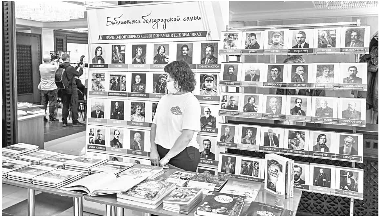
В последние годы в Белгородской области выпускается много качественных краеведческих книг, которые тоже можно изучать на уроках родной литературы

Задача нового предмета — познакомить школьников с произведениями фольклора, русской классики и современной литературы, которые не входят в список обязательных произведений, представленных в программе по предмету «Литература», но при этом максимально ярко воплотили национальную специфику русской литературы и культуры.