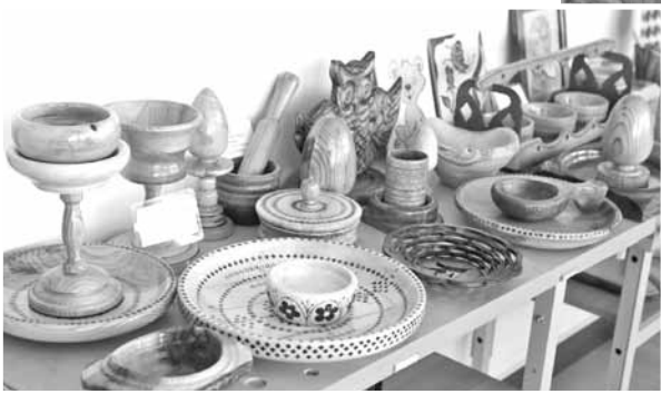
Изделия из дерева, сделанные школьниками на уроках технологии