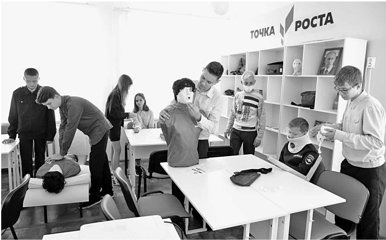
Занятия по оказанию первой медицинской помощи

Конечно, «Точкой роста» сейчас никого не удивишь. В Белгородской области уже привыкли, что даже небольшие сельские школы постепенно оснащаются современным оборудованием, а ребята учатся программировать, конструировать, управлять квадрокоптерами и легко осваивают цифровую технику.