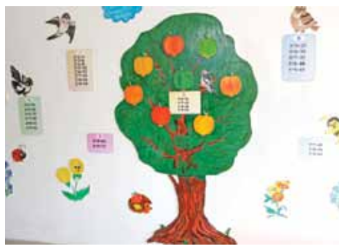
Владимировская школа. Стены тоже помогают учиться!

В кабинете логопеда — мультимедийный коррекционно-развивающий комплекс «Живой звук». Он очень полезен для ребят, которые плохо слышат и говорят. Упражнения с использованием «Живого звука» помогают исправить нарушения речи, развивают слуховую память, произношение, навыки связной речи и общения, память, мышление и т.д.