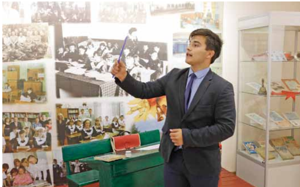
В музее Владимировской школы