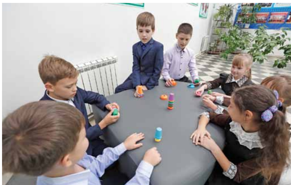
В художественно-эстетической зоне Верхопенской школы можно и проводить занятия, и играть