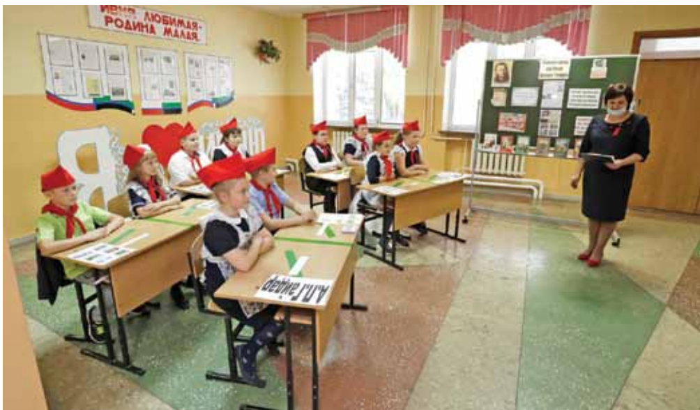
Занятие, посвящённое творчеству Аркадия Гайдара, во время внеурочной деятельности в Ивнянской школе № 1

Елена МЕЛЬНИКОВА » ТЕКСТ