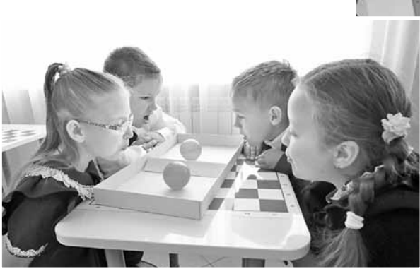
Дыхательная гимнастика на интерактивной переменке