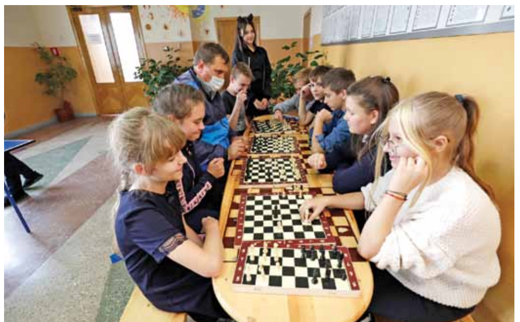
Шахматная зона в Ивнянской школе № 1