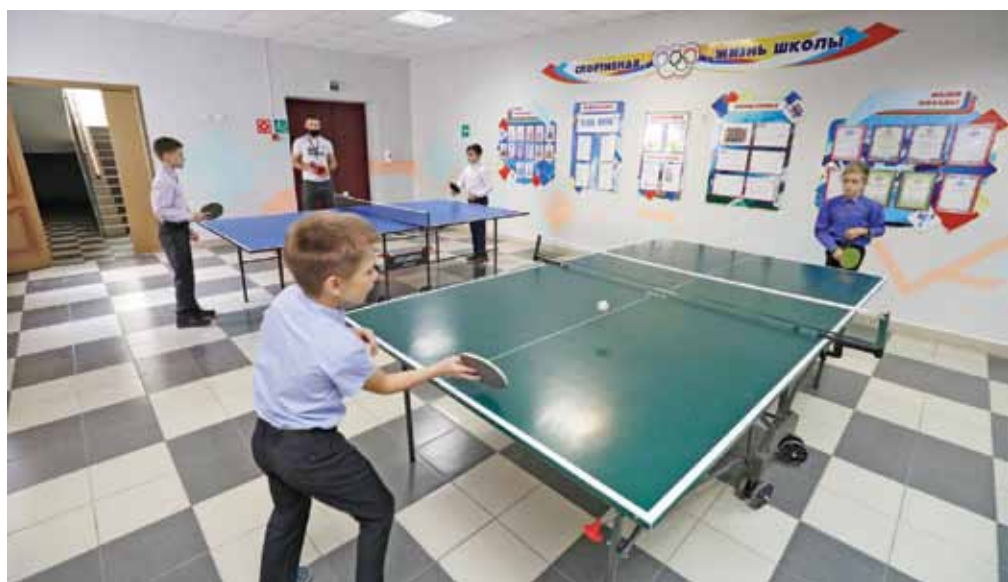
В настольный теннис в Верхопенской школе с удовольствием играют и дети, и взрослые