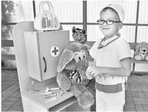
В «Ветклинике» дошколята печат плюшевых зверей