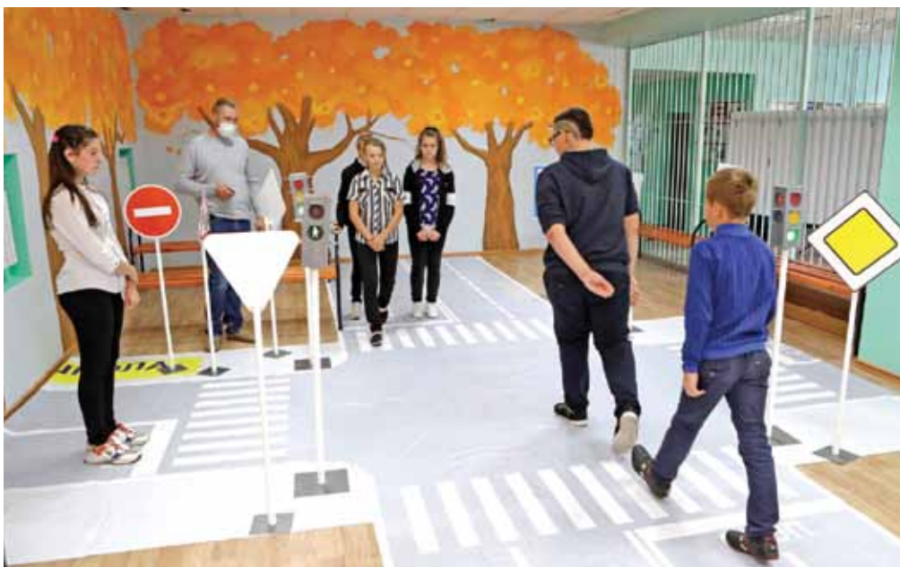
Интерактивная площадка для изучения Правил дорожного движения в Курасовской школе