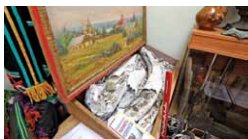
Гордость музея Курасовской школы — настоящий бивень мамонта!