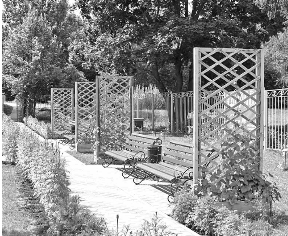
Вислудубравская школа Губкинского горокруга