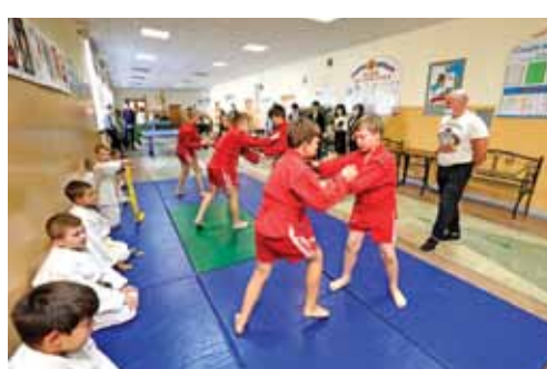
В Ивнянской школе № 1 действует секция самбо и дзюдо, где занимаются более 50 мальчишек и девочек