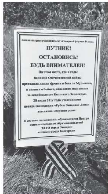
Белгородские школьники посадили аллею в Зозерёске

А сколько ребят мечтают попасть в программу по обмену в город Зозерёк Мурманской области! Четыре года назад между Белгородом и Зозерёком подписано соглашение о сотрудничестве. В том числе и в деле патриотического воспитания. Ведь этот северный город — база атомных подлодок Северного флота! С 2017 года ребята из Мурманской области каждый год отдыхают на Белгородской земле, а белгородские школьники едут в военный городок, живут в палатках на берегу реки, знакомятся с настоящими моряками, посещают подводные лодки! Попасть в делегацию по обмену трудно, здесь строгий конкурсный отбор: нужно предоставить портфолио и доказать, что у тебя есть достижения в спортивно-туристской деятельности, лидерские качества. Ну и согласие родителей обязательно.