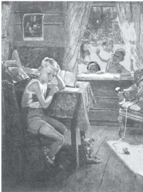
Перезаменюк. Картина Фёдора Решетникова. 1954 г. Горловский художественный музей, Донецкая область (третья часть трилогии)

действие на учебную мотивацию школьника и окончательно расколачивают его.