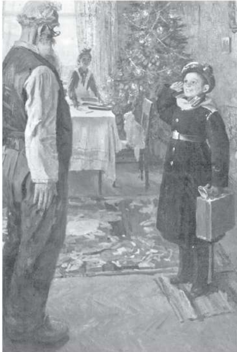
Прибыл на каникулы. Картина Фёдора Решетникова. 1948 г. Государственная Третьяковская галерея, г. Москва (первая часть трилогии)

Но есть и другая группа учеников — и их, к сожалению, большинство, — которых двойка мотивирует не на получение новых знаний, а на то, как в следующий раз с наименьшими потерями обойти возникшие трудности. И тут на первый план выходят те самые многочисленные ГДЗ, которые оказывают ещё более разрушительное воз-