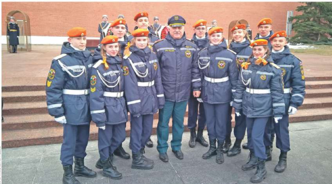
2019 год. Победители XVI Всероссийского кадетского сбора в Москве

1979 год. Хмельницкое окончено. Куда же направят служить? Волей судьбы вновь оказался