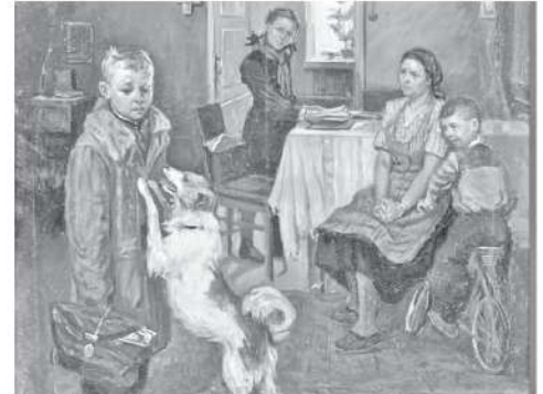
Опять двойка. Картина Фёдора Решетникова. 1952 г. Государственная Третьяковская галерея, г. Москва (вторая часть трилогии)

Двойка часто воспринимается учениками как личная обида, как жуткая несправедливость по отношению к себе. Школьник может принять отметку не как оценку его знаний в конкретный момент, а как оценку его личности, как проявление неприязни со стороны учителя. И тут может назреть конфликт.