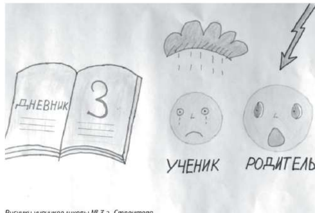
Рисунки учеников школы № 3 г. Строителя