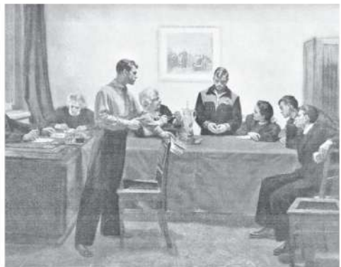
Обсуждение двойки. Картина Сергея Григорьева. 1953 г. Государственная Третьяковская галерея, г. Москва

Ещё одна картина — «Обсуждение двойки» Сергея Григорьева — изображает заседание комсомольского комитета советской школы, где разбирается дело старшеклассника, получившего двойку. Мы понимаем, что двойка этого ученика перестала быть его личным делом и делом его семьи, а стала предметом внимания всего школьного коллектива. Тот самый двоечник, по всей видимости, спортсмен, стоит смущённо перед суровым обвинителем из комсомольского актива. Рядом сидит пожилая учительница и смотрит на него добрыми глазами. Может, это она и поставила ему ту самую эпизодическую двойку, а теперь переживает не меньше, чем сам виновник этого заседания. Конечно, в наше время уже тяжело представить себе, что полученную кем-то двойку обсуждают на совете старшеклассников или другом органе ученического самоуправления.