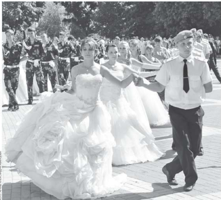
Кадетский бал в Белгороде

Конечно, кадеты-первоклашки — это явление редкое. В основном именно по кадетской программе ребята занимаются с пятого класса. Лишь в трёх школах Белгорода первоклашки уже с первых дней учёбы приобщаются к военной науке: в 19-й, 21-й и 41-й. Есть в Белгороде и полностью кадетская школа — 45-я. В остальных школах в каждой параллели есть хоть один обычный, некадетский класс: не все ребята хотят углублённо изучать военную подготовку. В 45-й школе, кстати, тоже не всех заставляют шагать строем и участвовать в кадетских мероприятиях. Если у ребёнка и родителей нет жела-