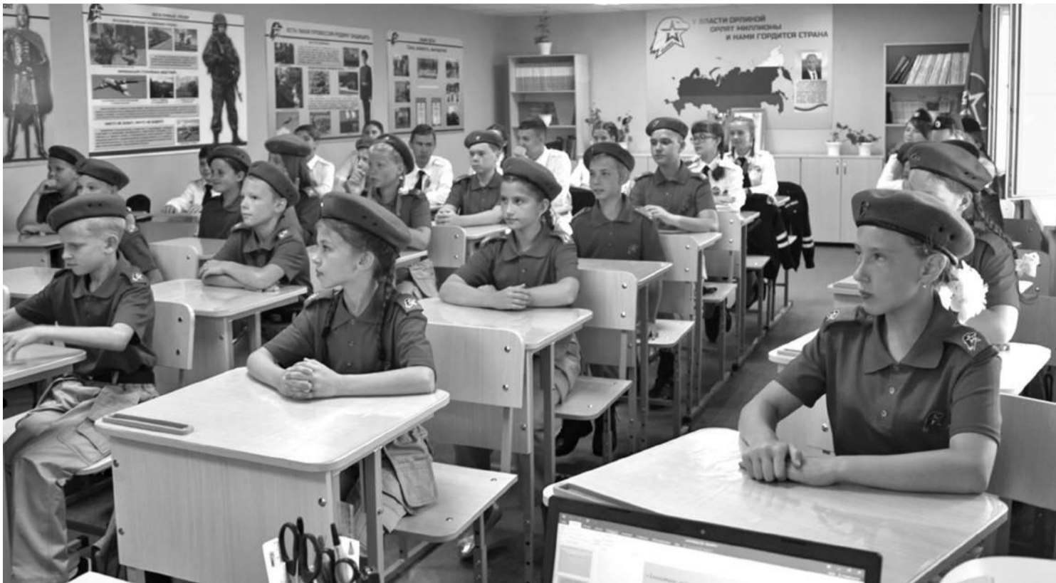
Кадетский класс школы № 1

В результате реализации проекта в школе создали лабораторию, которую можно без преувеличения назвать кузницей пытливых, талантливых юных исследователей. Ученики от четвёртого до выпускного классов занимаются наукой. В рамках постпроектной деятельности рядом с лабораторией оформлена развивающая зона «Химия занимательная и увлекательная», которая рассказывает об опытах,