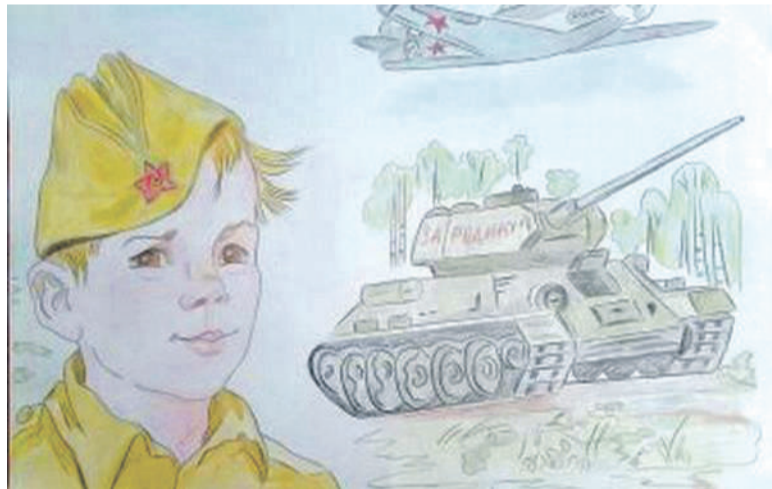
Рисунок Дарьи Лопиной (Корочанская школа им. Д. Кромского)